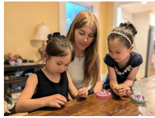
en pleine activité manuelle