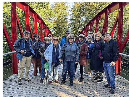
Entrée dans Bruges