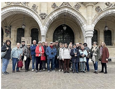
Arras, façade style flamand

d'Arras avec ses grandes places entourées de façades éblouissantes de style flamand, avec la découverte des Boves à 12 mètres sous les pavés ainsi que la montée assez sportive au sommet du Beffroi (et la vue exceptionnelle qui récompense l'escalade périlleuse par l'escalier en colimaçon), et bien sûr notre journée exceptionnelle à Bruges, la petite Venise du Nord, dont la visite nous a tous ravis à travers les commentaires de nos deux guides conférenciers retraçant l'histoire du centre médiéval et en terminant par la mini-croisière sur les canaux. Tout cela sous un très beau temps exceptionnel tout au long de notre voyage.