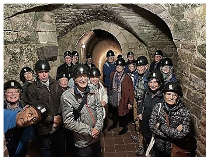
Boves sous les pavés d'Arras