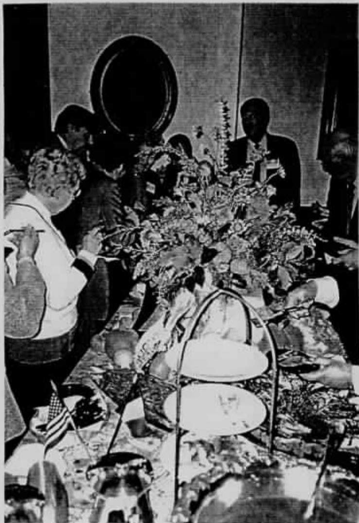
Le "Vieux Capitole" à Boston.