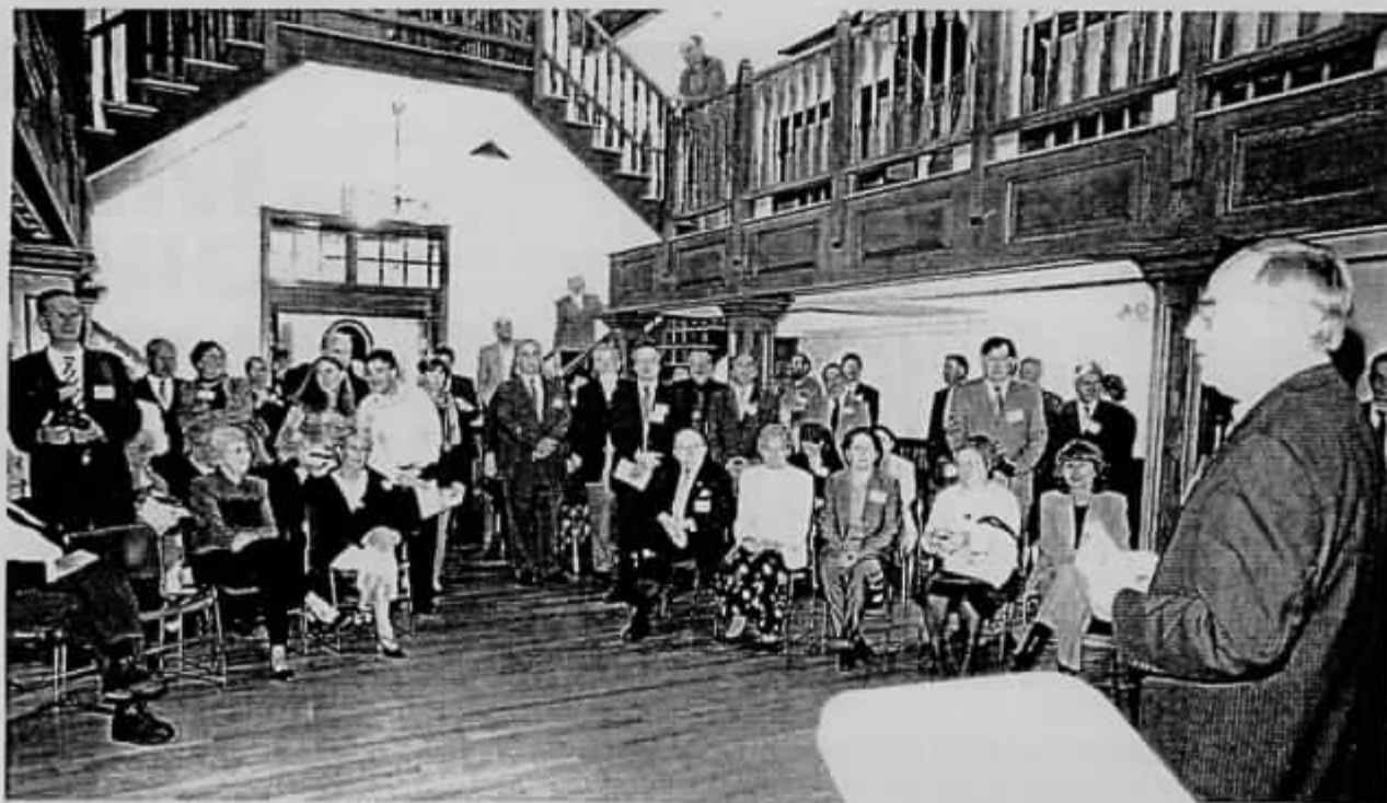
L'ensemble des participants français et américains pendant les discours le soir de la réception officielle à la Mairie de Winchester le Jeudi.