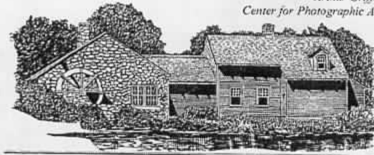
Arthur Griffin Center for Photographic Art