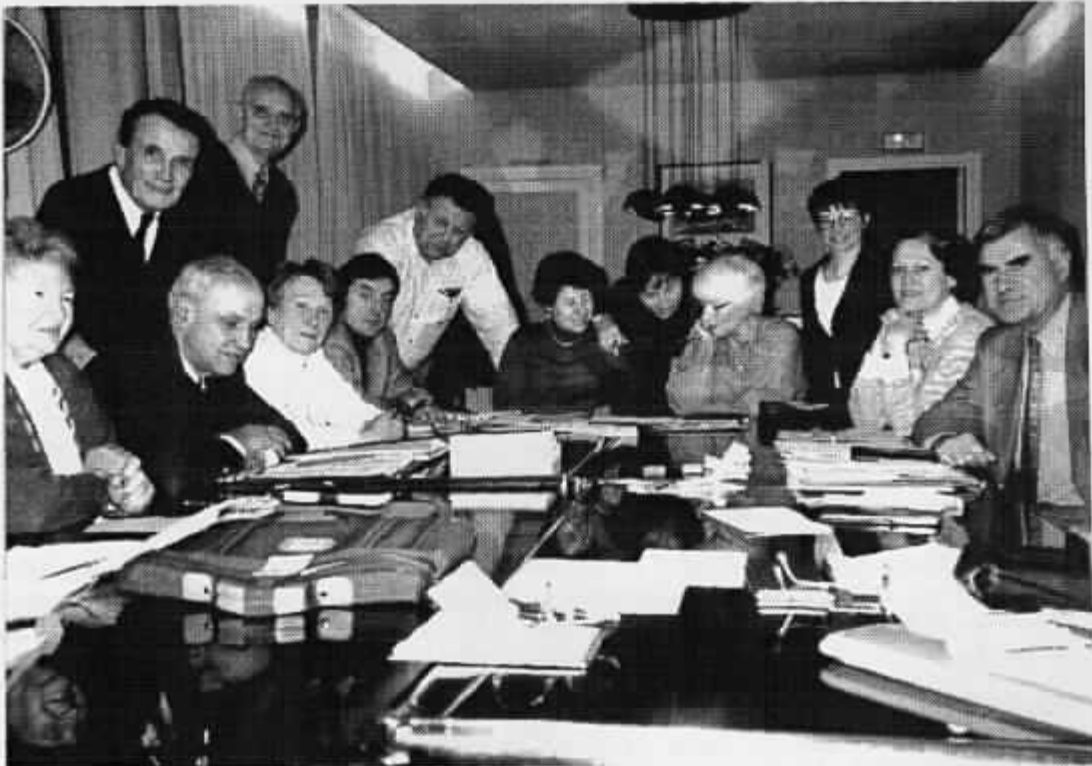
Une séance de notre conseil d'administration