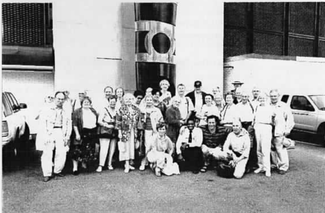
Photo du groupe